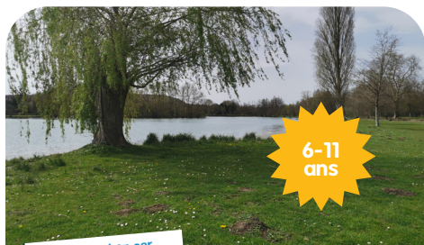
Transport en car